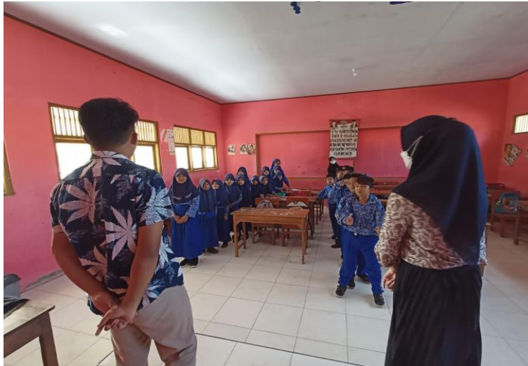
Gambar 6 Kegiatan pembelajaran dan ice breaking