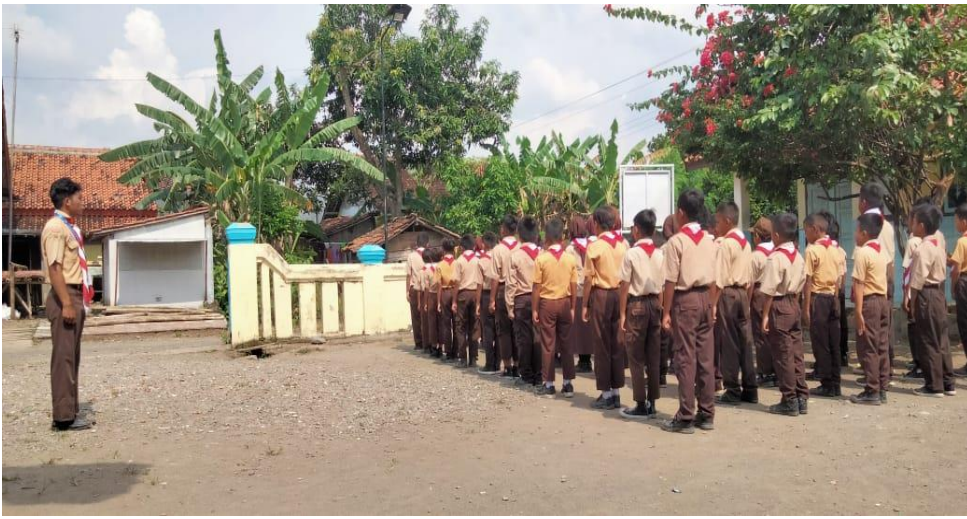
Kegiatan ekstrakurikuler pramuka