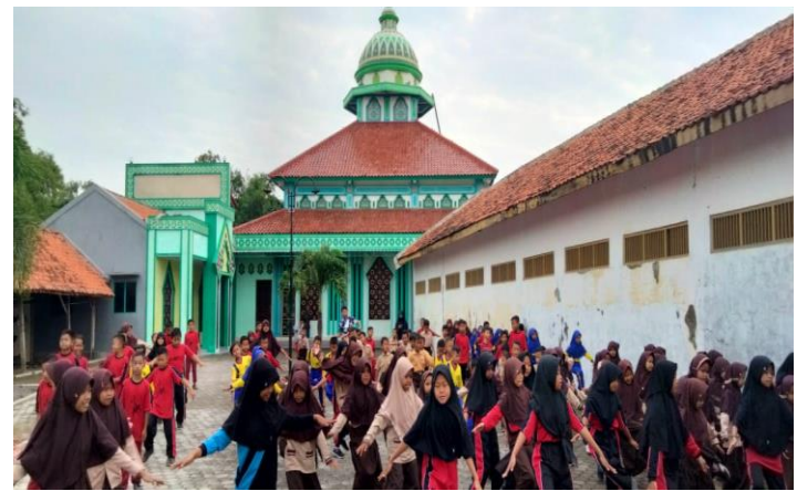
Kegiatan senam pagi