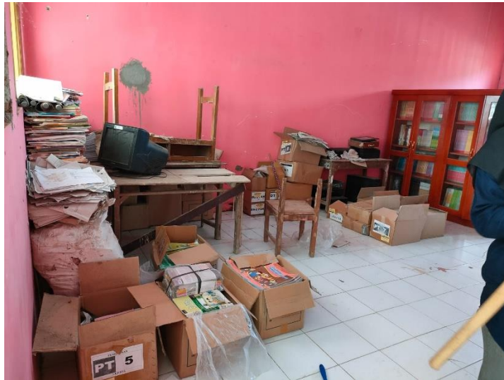
Gambar 45 kondisi awal perpustakaan