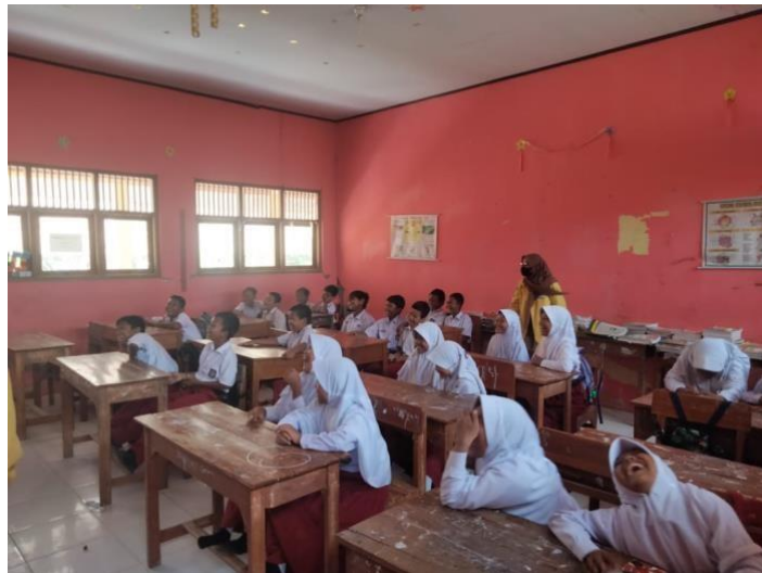
Gambar 2 Ujian Tengah Semester dan ice breaking