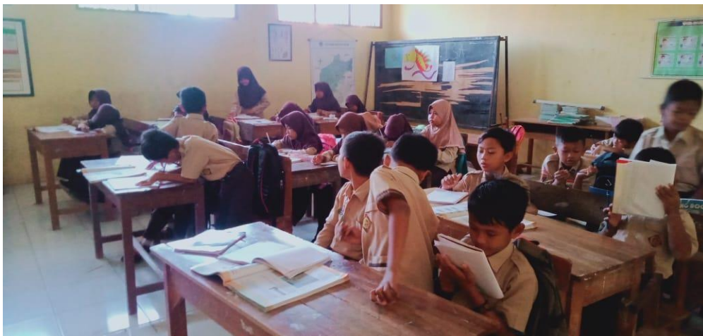
Gambar 5 Kegiatan pembelajaran