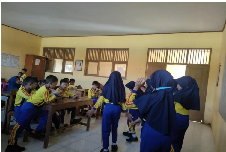
Gambar 31 Kegiatan persiapan pelepasan kelas 6