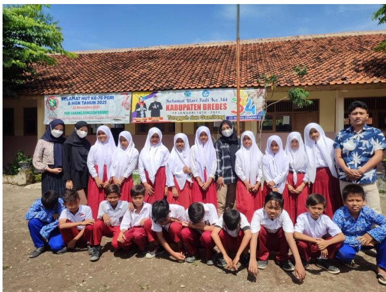
Gambar 5 Foto Bersama setelah pembelajaran