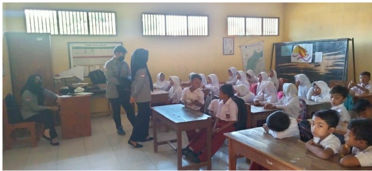
Gambar 30 Sosialisasi perlombaan antarkelas