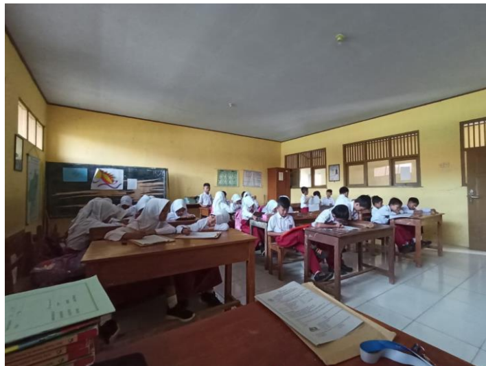
Gambar 23 Kegiatan Penilaian Akhir Semester