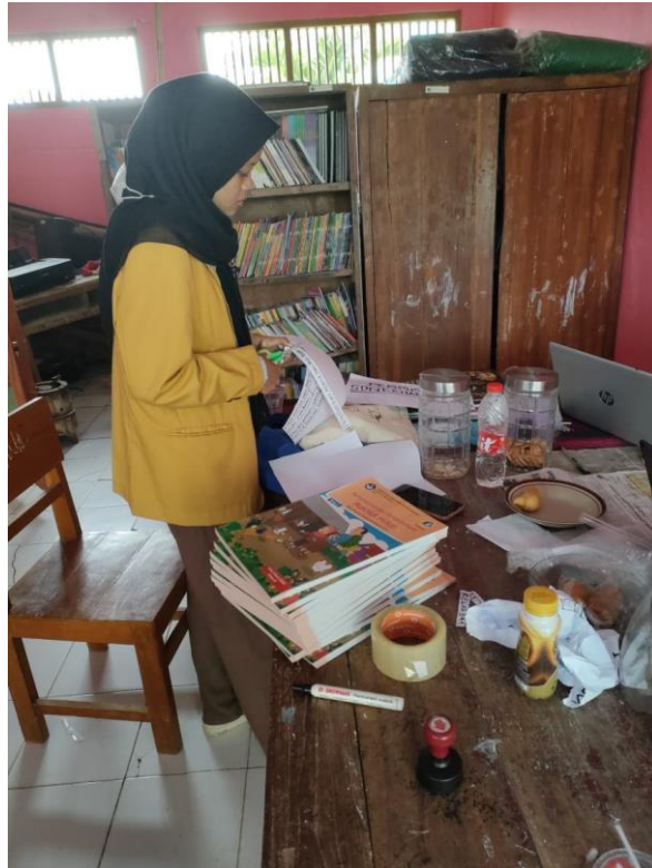
Gambar 41 Merapihkan perpustakaan