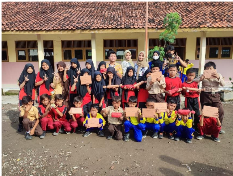
Gambar 38 Pembagian hadiah perlombaan antarkelas