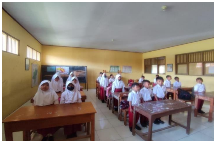
Gambar 1 menyanyikan lagu Indonesia Raya