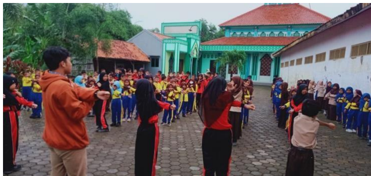
Gambar 6 kegiatan senam dan games