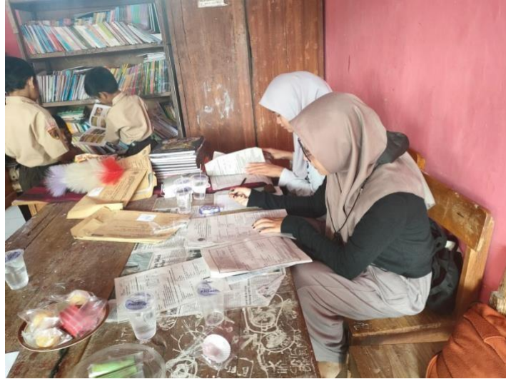
Gambar 6 Kegiatan tambahan belajar