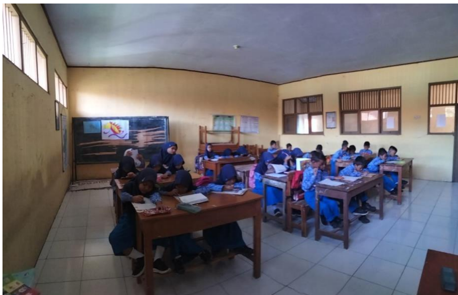
Gambar 4 Ujian Tengah Semester