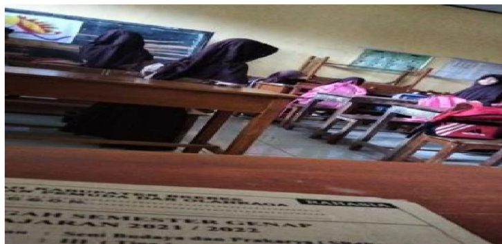
Gambar 5 Kegiatan Ujian tengah semester