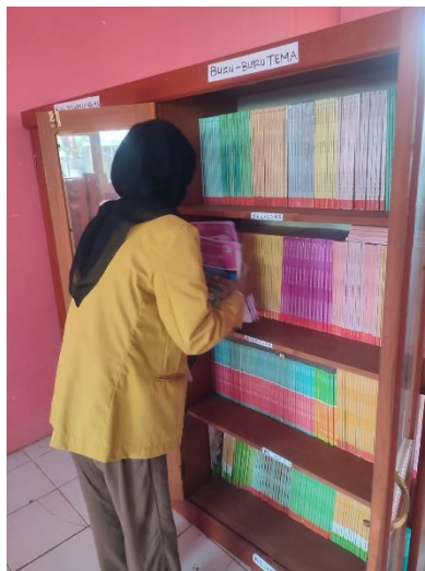
Gambar 46 Penataan Ulang Buku di Perpustakaan