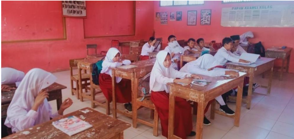
Gambar 2 Kegiatan pembelajaran