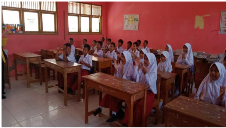
Gambar 3 Pembelajaran dan ice breaking