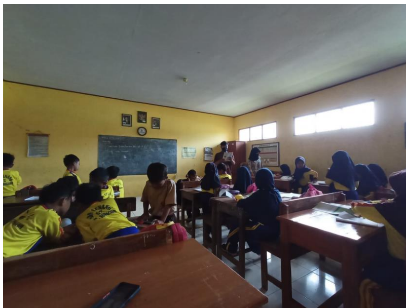
Gambar 16 kegiatan pembelajaran