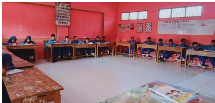
Gambar 4 kegiatan belajar mengajar