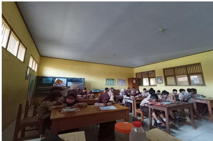
Gambar 27 Kegiatan Penilaian Akhir Semester