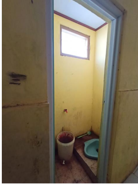
Gambar 44 kamar mandi siswa