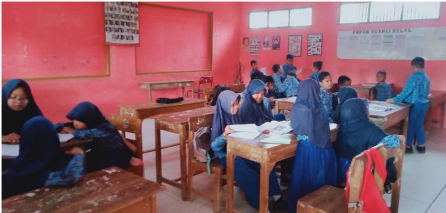
Gambar 20 Kegiatan Pembelajaran