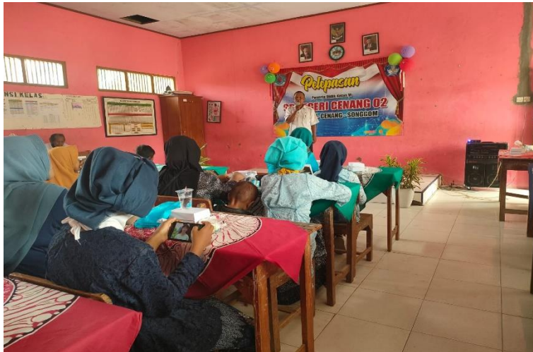
Gambar 33 Kegiatan pelepasan kelas 6