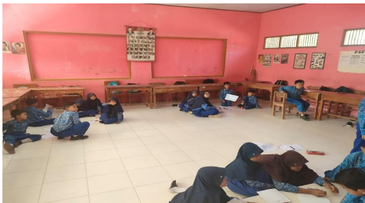
Gambar 13 Kegiatan Pembelajaran