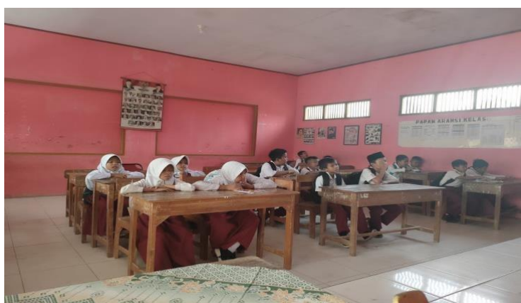
Gambar 2 kegiatan belajar mengajar