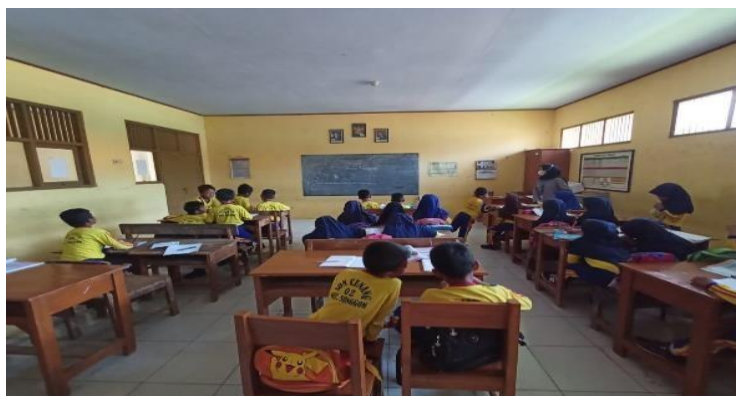
Gambar 3 kegiatan ice breaking