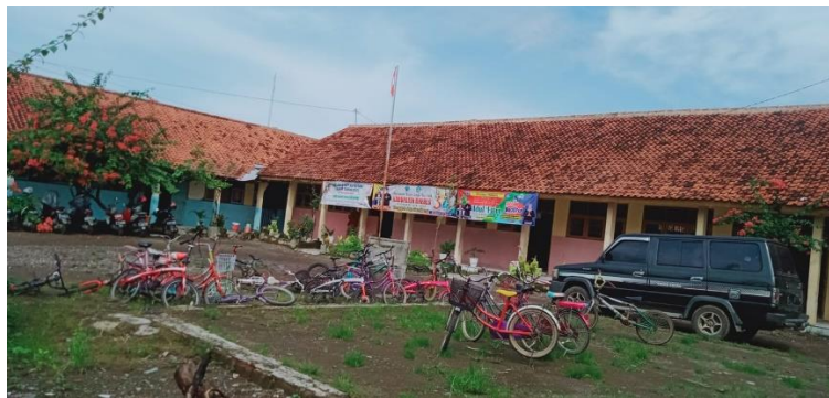
Gambar 40 Piket di sekolah