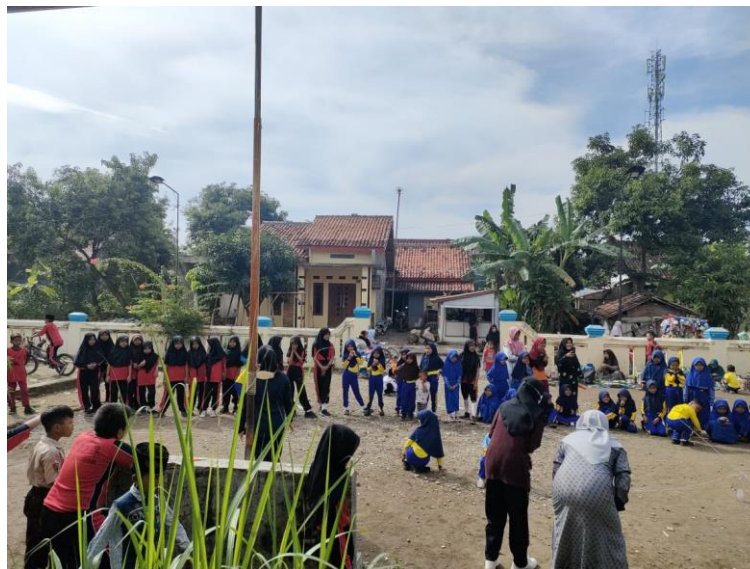
Gambar 36 Perlombaan antarkelas