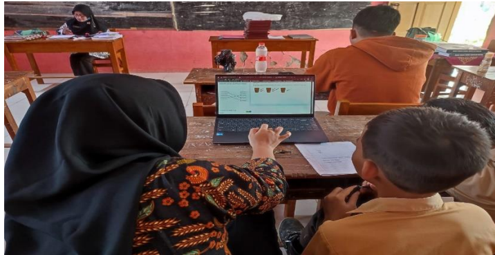
Gambar 22 Kegiatan pembelajaran