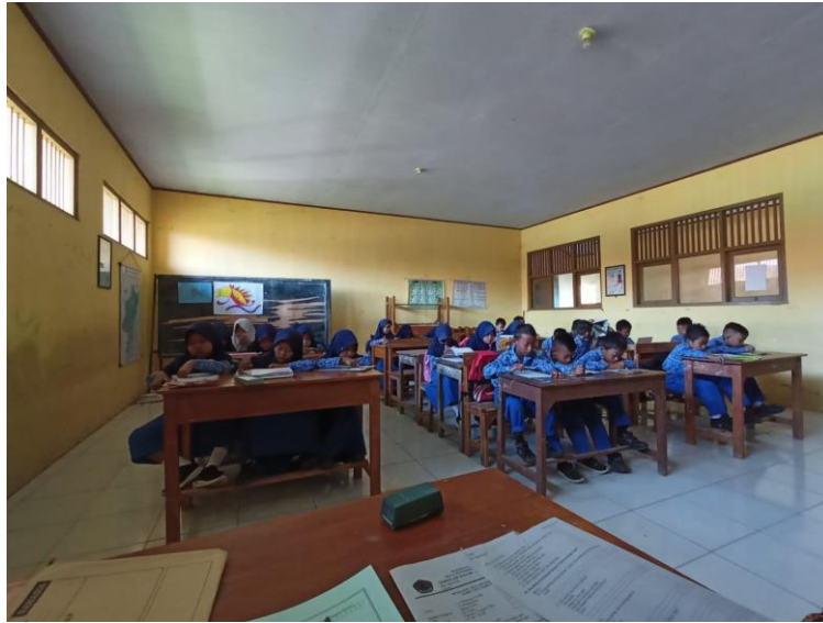
Gambar 26 Kegiatan Penilaian Akhir Semester