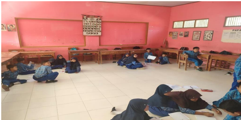
Gambar 3 Kegiatan pembelajaran