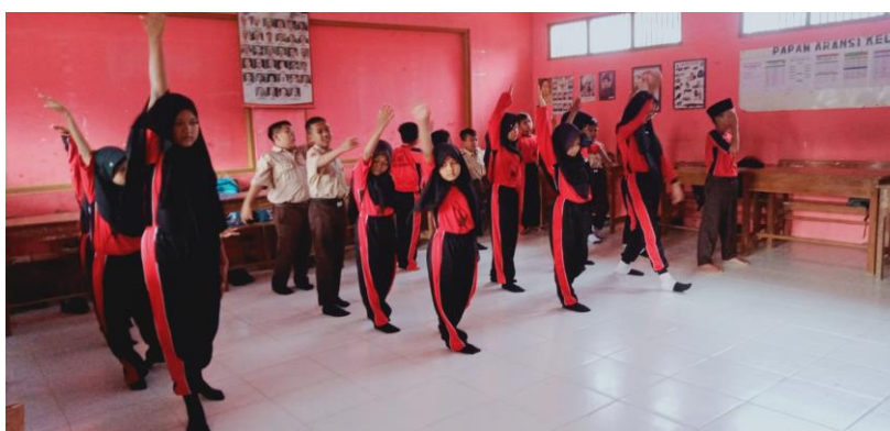
Gambar 14 Kegiatan Pembelajaran PJOK