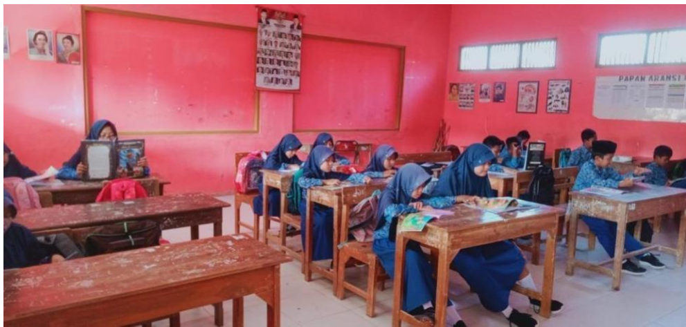
Gambar 3 Kegiatan pembelajaran