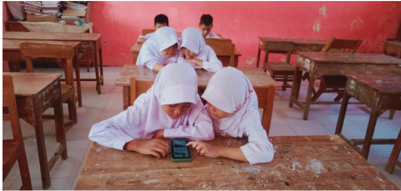
Gambar 24 Kegiatan Post-Test AKM