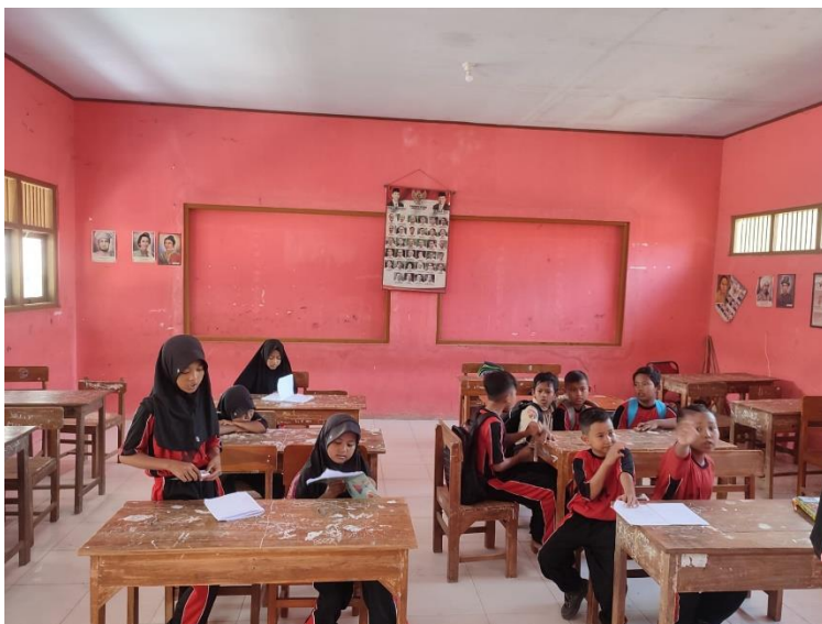
Gambar 10 Kegiatan tambahan belajar