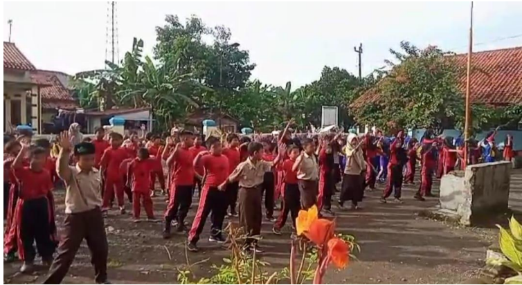
Gambar 37 Kegiatan senam bersama