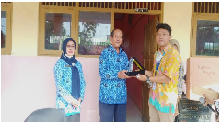
Kegiatan pemberian kenangan kepada SD