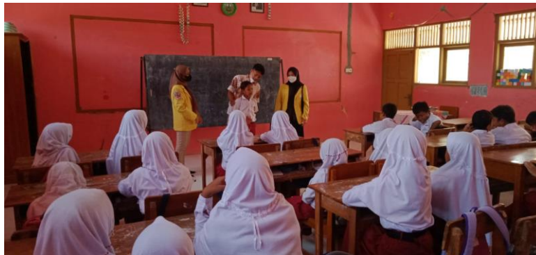
Gambar 4 Kegiatan pembelajaran dan ice breaking