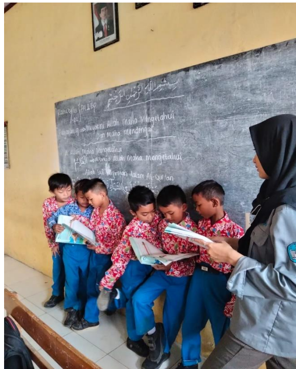
Gambar 8 Kegiatan presentasi berkelompok