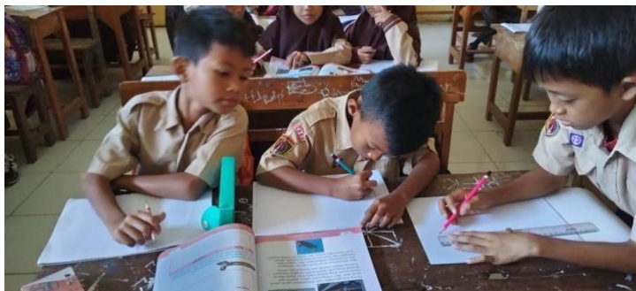
Gambar 5 Kegiatan Pembelajaran