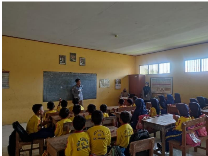
Gambar 9 Kegiatan pembelajaran dan games