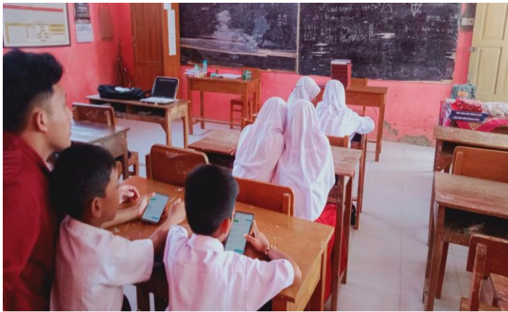
Kegiatan pelaksanaan AKM