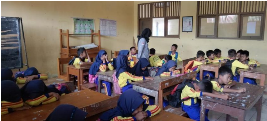
Gambar 2 kegiatan ice breaking