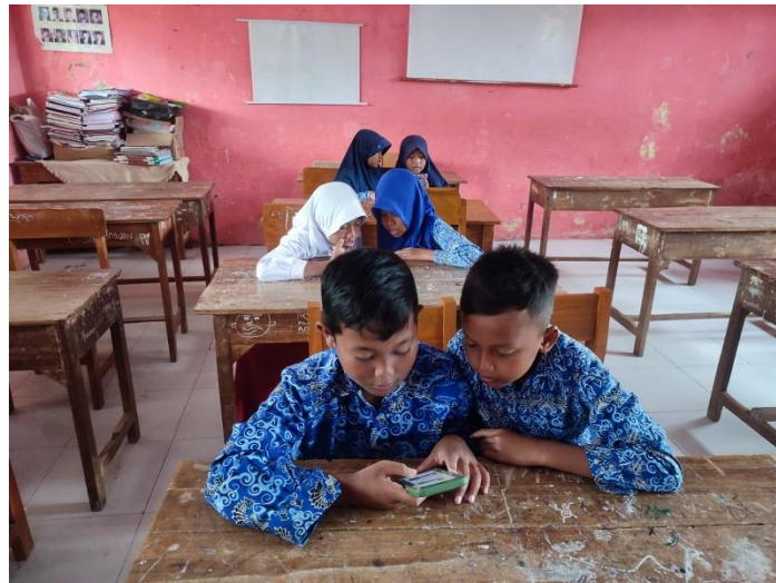
Gambar 25 Kegiatan Post-Test AKM