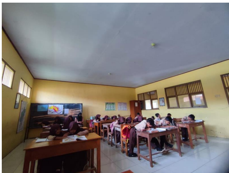
Gambar 17 kegiatan pembelajaran