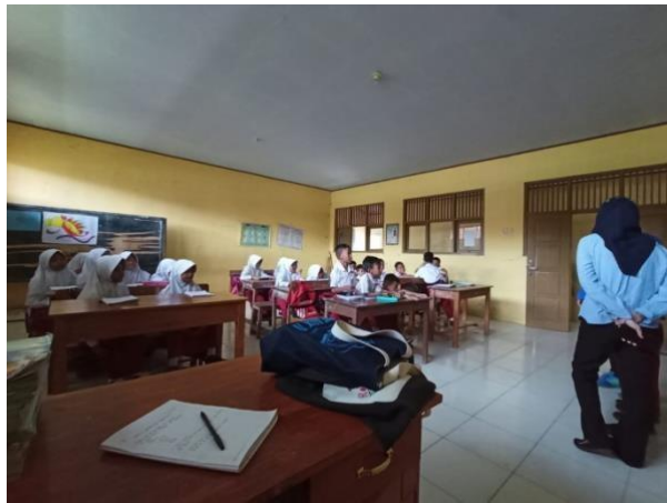
Gambar 1 Kegiatan pembelajaran