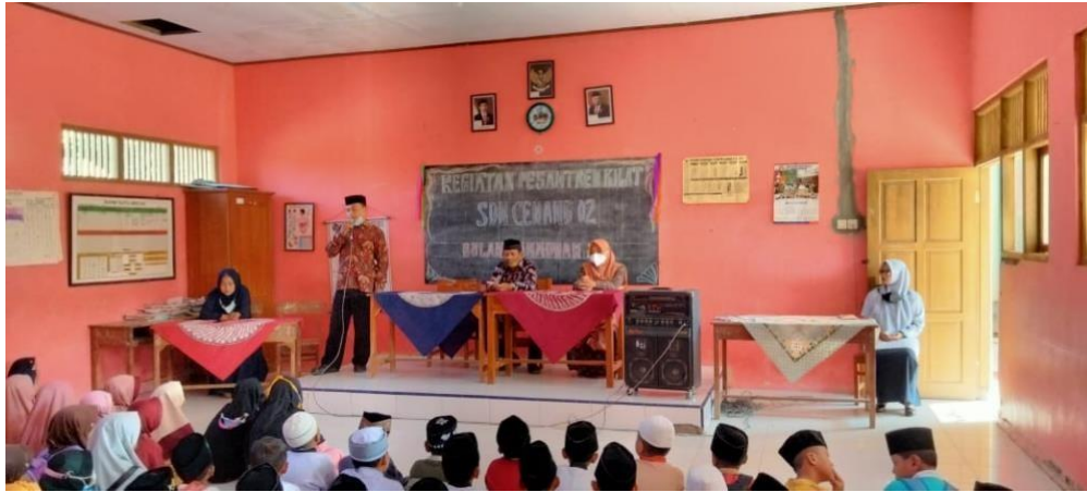
Gambar 1 Kegiatan pesantren kilat