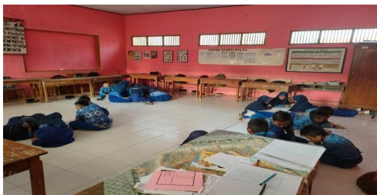
Gambar 5 kegiatan belajar mengajar (berkelompok)