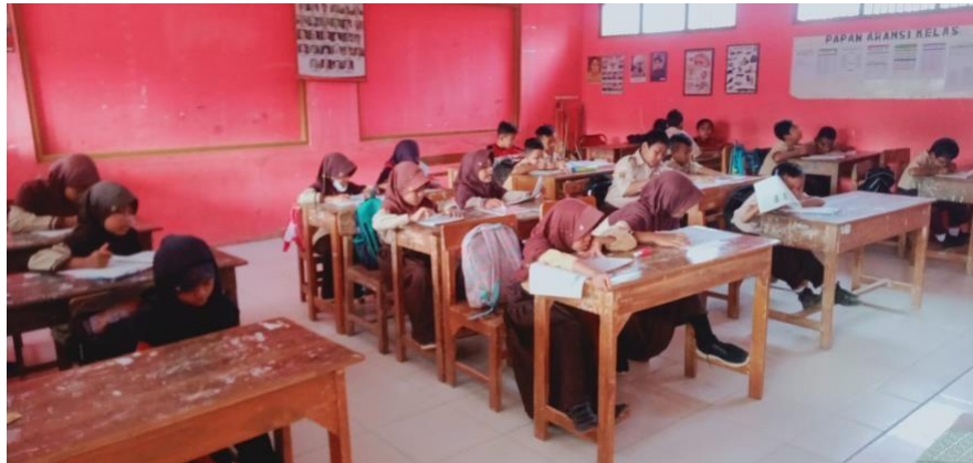
Gambar 6 kegiatan belajar mengajar