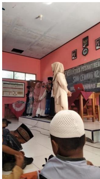
Gambar 3 Kegiatan Pembelajaran