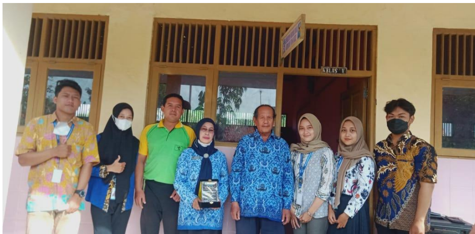
Gambar 48 Pelepasan Mahasiswa Kampus Mengajar di Sekolah