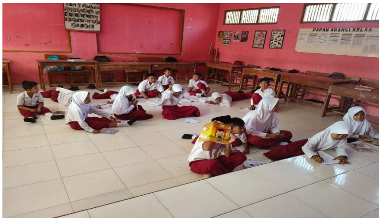
Gambar 11 Kegiatan Pembelajaran