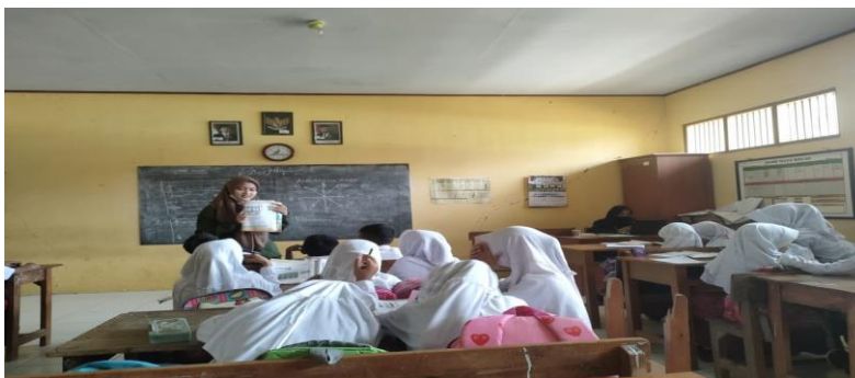
Gambar 18 Kegiatan pembelajaran