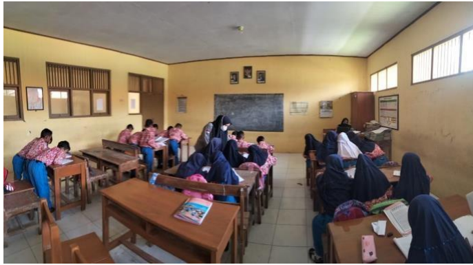
Gambar 3 Kegiatan Pembelajaran