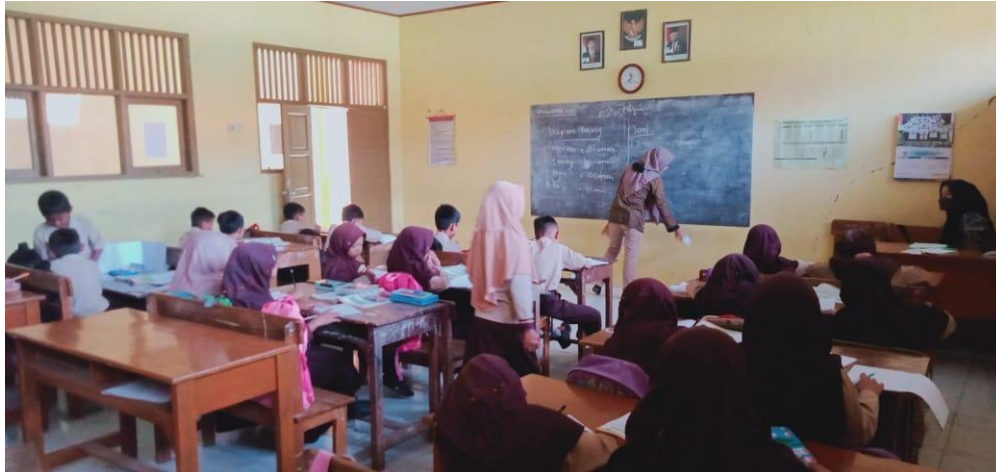
Gambar 4 Kegiatan pembelajaran