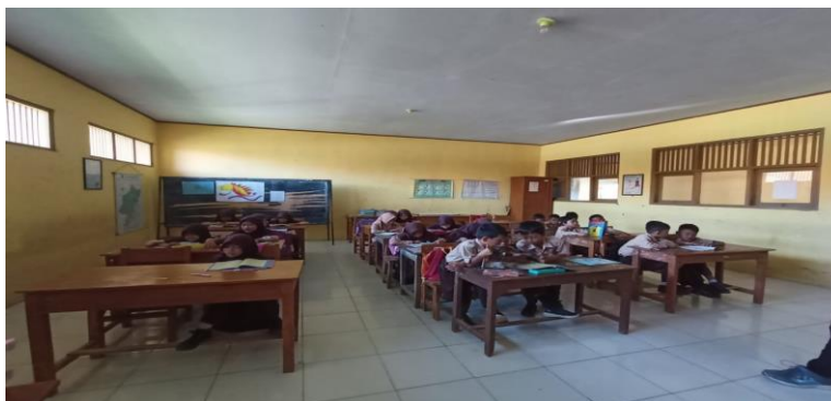
Gambar 15 Kegiatan Pembelajaran