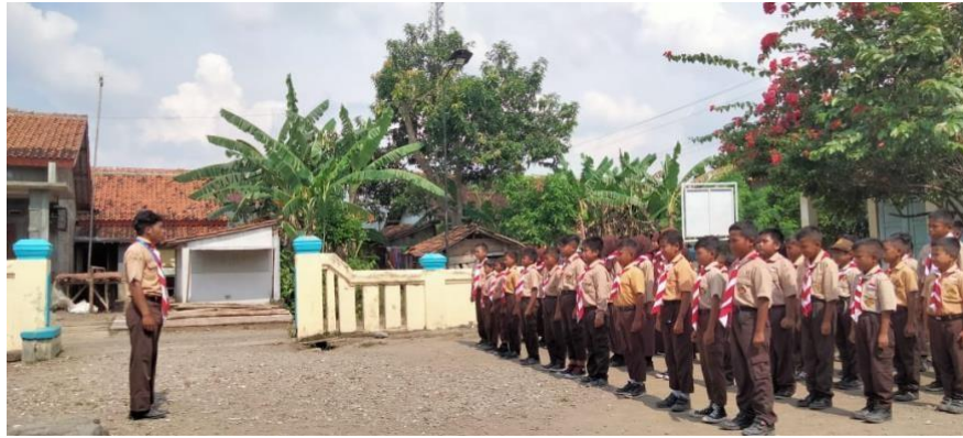
Gambar 5 kegiatan kepramukaan