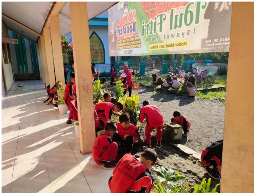
Gambar 5 Kegiatan bersih-bersih lingkungan sekolah Sabtu 21 Mei 2022