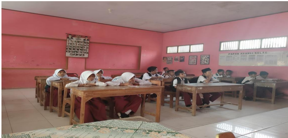
Gambar 2 Kegiatan pembelajaran