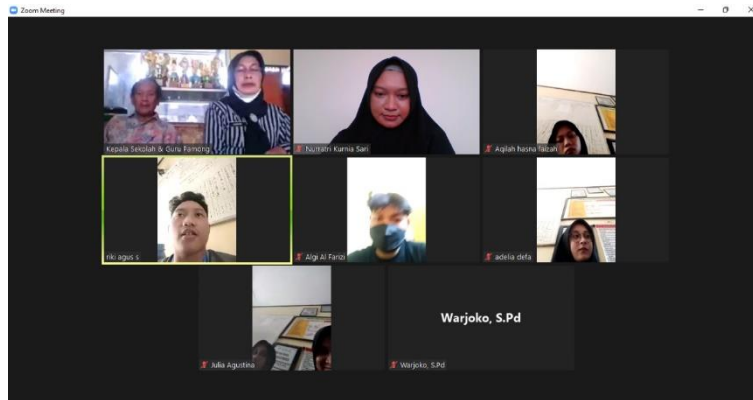
Gambar 35 Pelepasan mahasiswa kampus mengajar