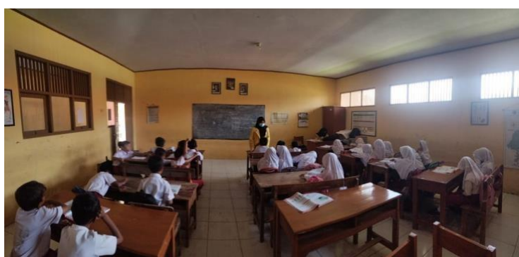
Gambar 2 kegiatan belajar mengajar