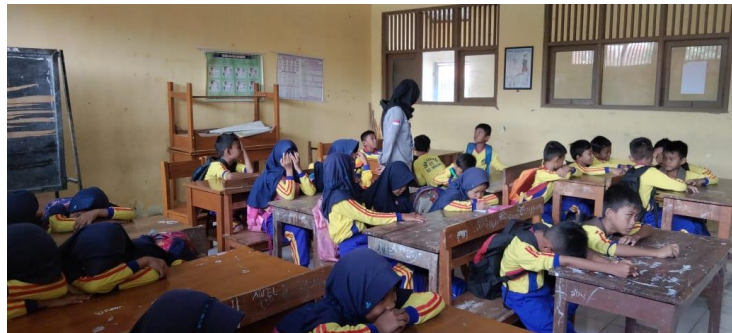
Gambar 12 Kegiatan Pembelajaran