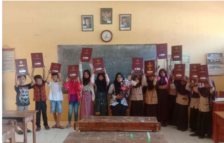
Gambar 39 Pembagian raport