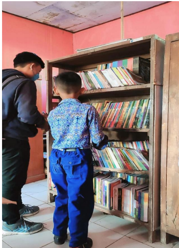
Gambar 7 Memilih buku bacaan