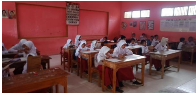
Gambar 1 Hari Ujian Tengah Semester