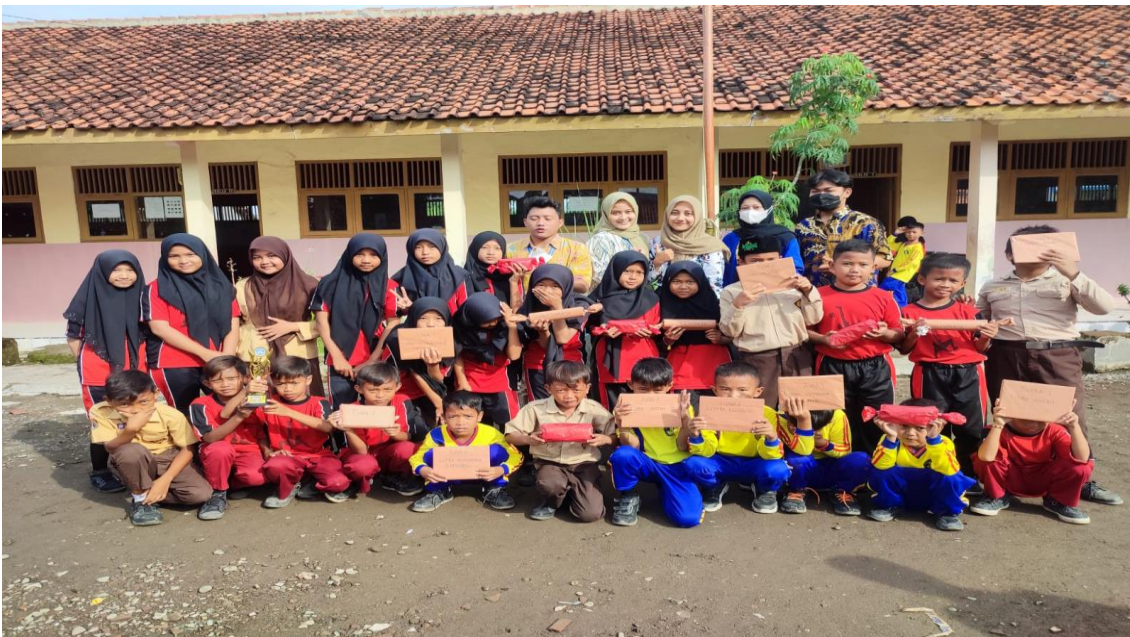
Kegiatan lomba antar kelas