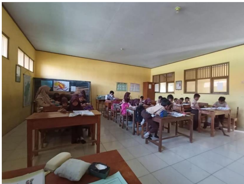
Gambar 6 Kegiatan pembelajaran