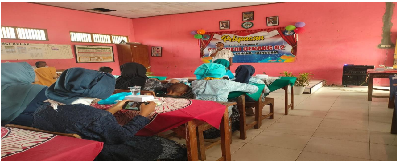
Kegiatan pelepasan kelas 6