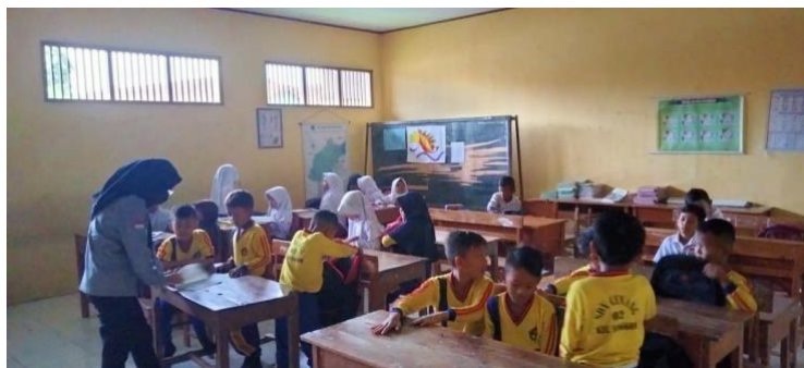
Gambar 3 kegiatan ice breaking