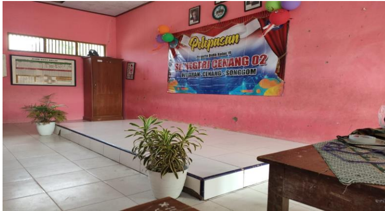
Gambar 32 Dekorasi ruangan