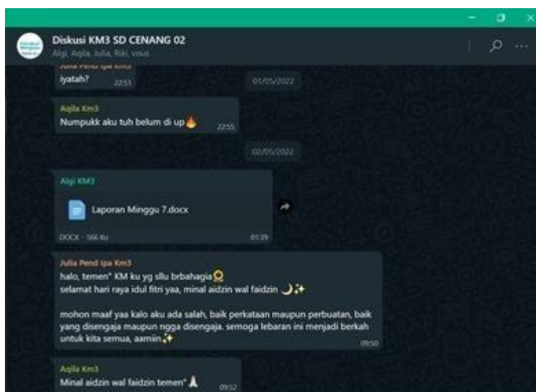
Gambar 1 Pengucapan Selamat Hari Raya Idul Fitri via WAG