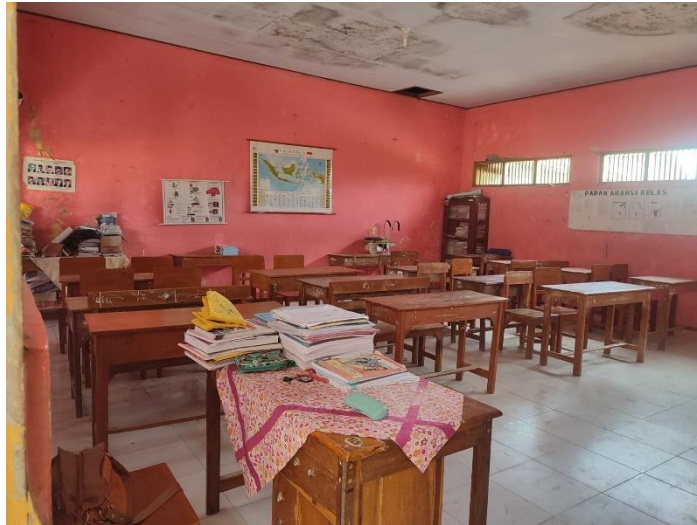
Gambar 42 ruang kelas