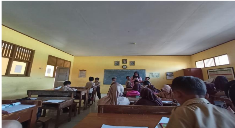
Gambar 28 Persiapan Keegiatan Pelepasan Kelas 6