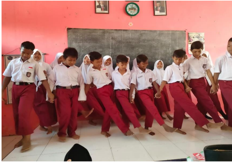
Gambar 29 Latihan acara pelepasan kelas 6