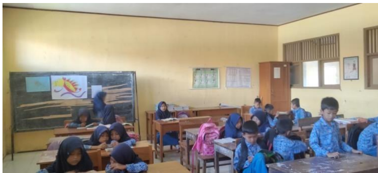
Gambar 2 Kegiatan Pembelajaran