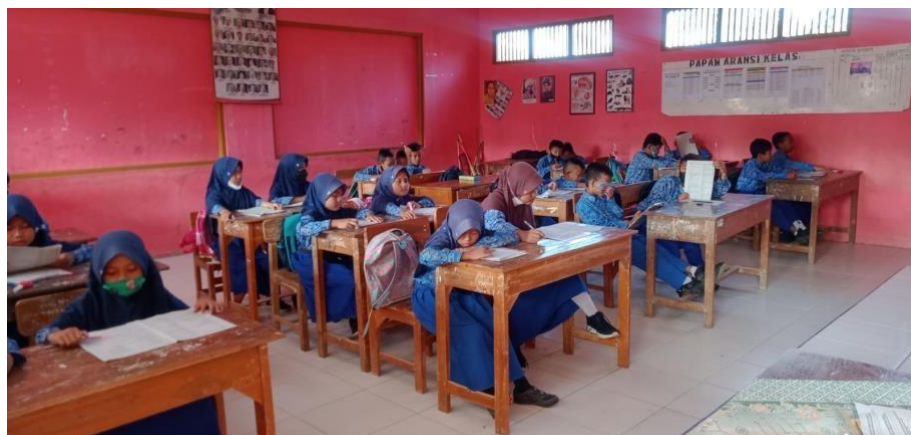
Gambar 3 Foto Ujian Tengah Semester