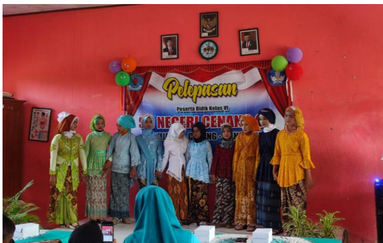
Gambar 34 Kegiatan pelepasan kelas 6