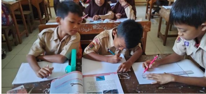
Gambar 5 Kegiatan Pembelajaran