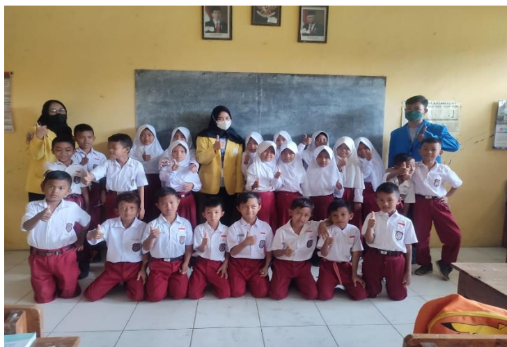
Gambar 2 Perkenalan dengan siswa