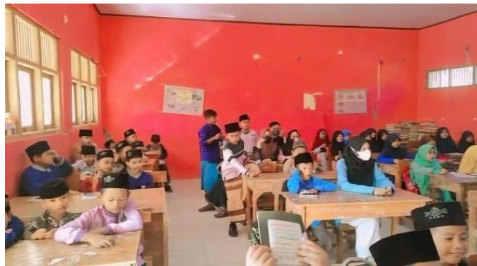
Gambar 2 Kegiatan Pembelajaran