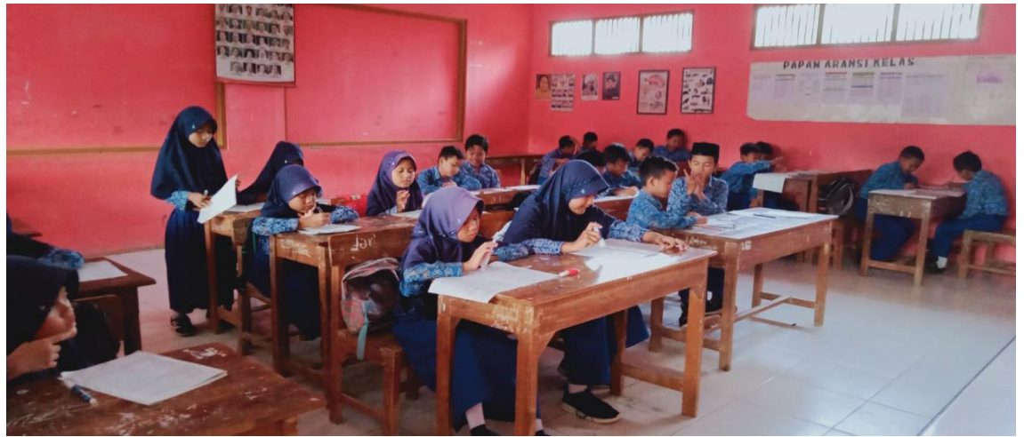
Kegiatan belajar mengajar dikelas