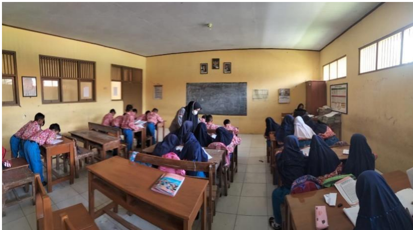
Gambar 3 kegiatan belajar mengajar