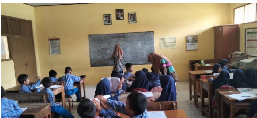
Gambar 4 kegiatan belajar mengajar