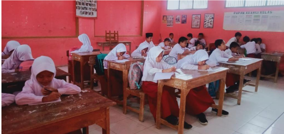
Gambar 1 Kegiatan pembelajaran