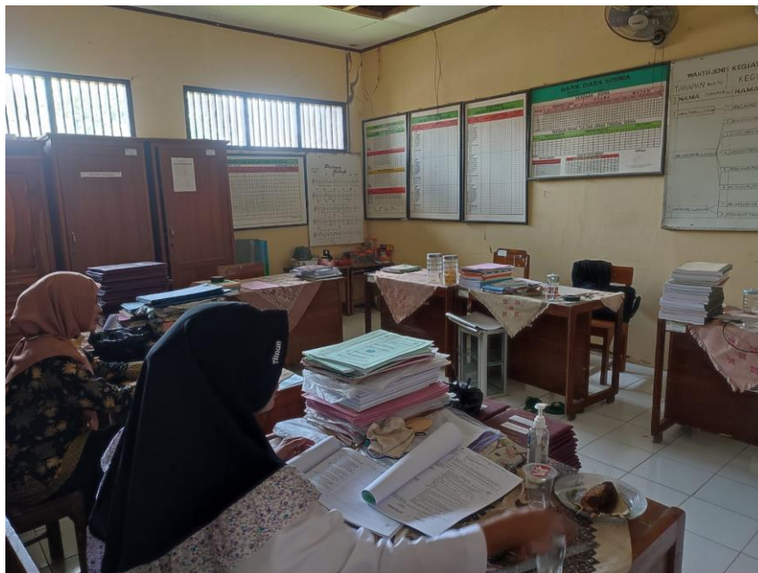
Gambar 43 ruang guru