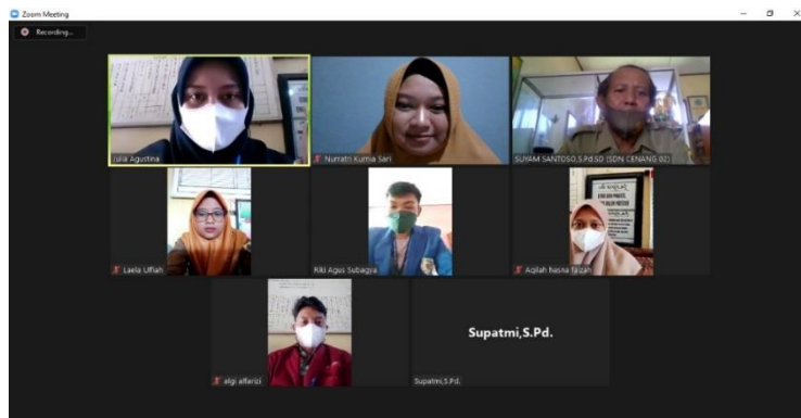
Gambar 1 Acara penyambutan oleh DPL dan Kepala Sekolah