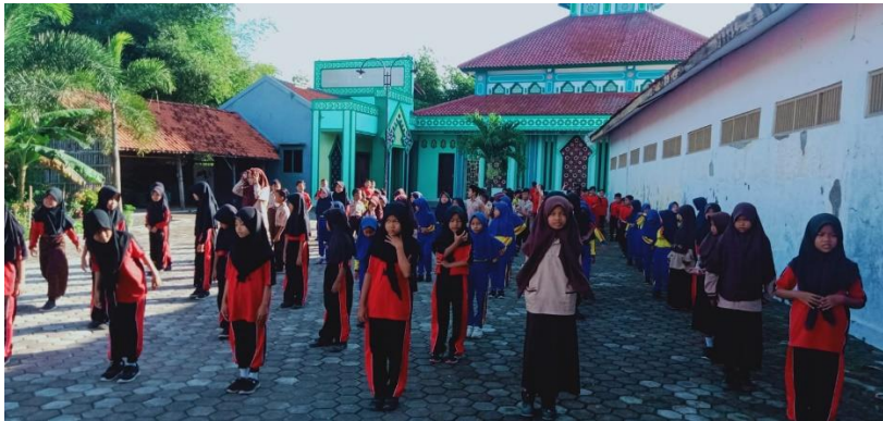
Gambar 21 Kegiatan pembelajaran