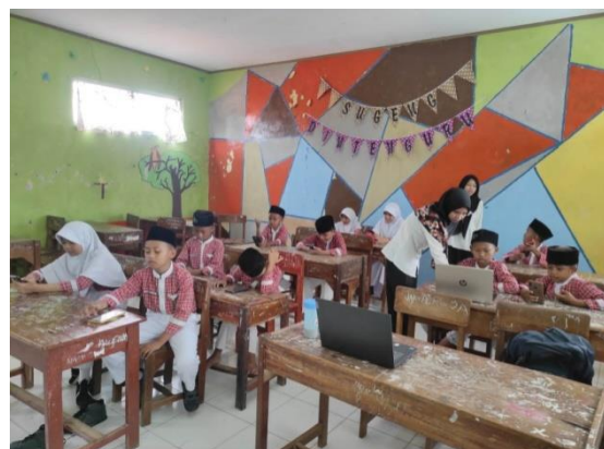
Post test AKM