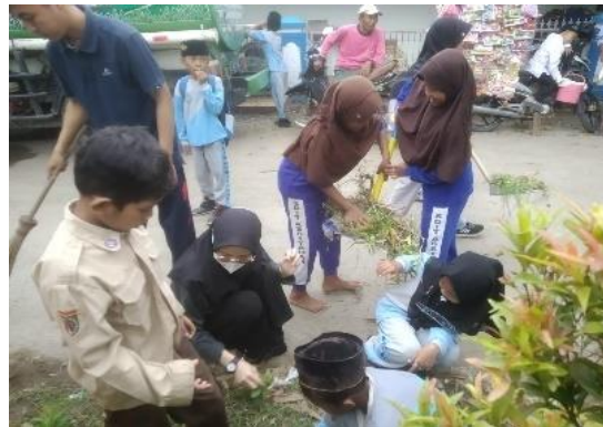
Kerja bakti membersihkan lingkungan sekolah