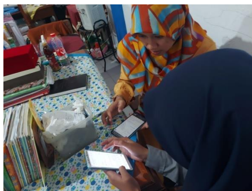
Pelatihan pembatan g.form dan zoom