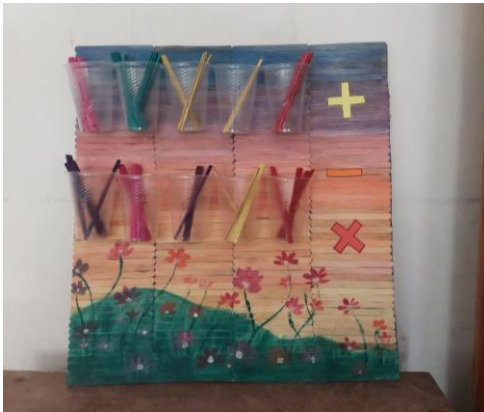
Pembuatan media numerasi