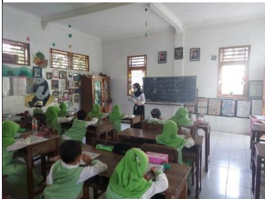
Mendampingi pembelajaran di kelas