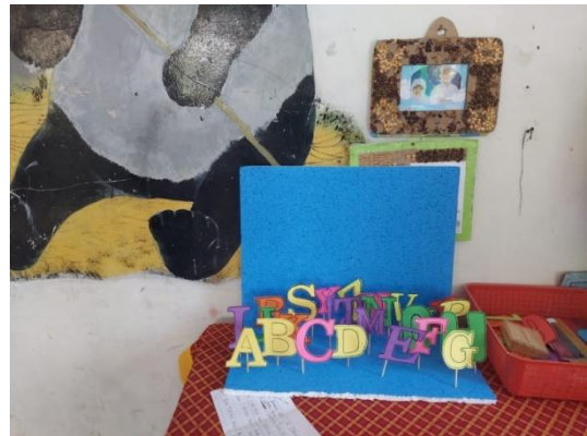
Pembuatan media literasi