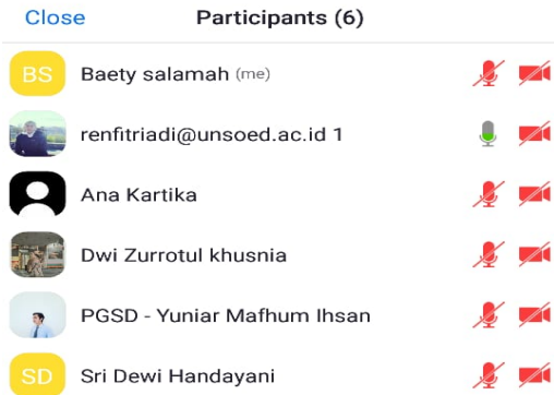
Rapat rutin bersama DPL