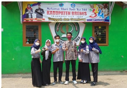
Kegiatan Forum komunikasi