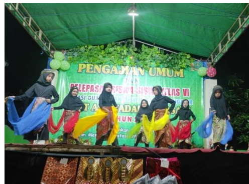
Pelepasan siswa kelas 6