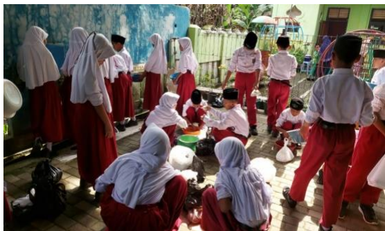
Pelatihan pembuatan telur asin