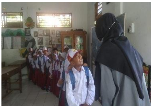
Penguatan literasi dan numerasi sepanjang sekolah